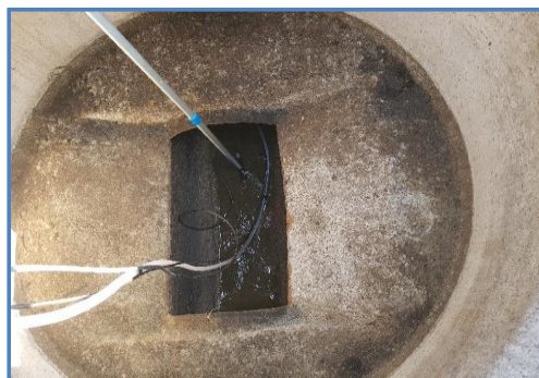
Fotografía 3: Punto de Monitoreo