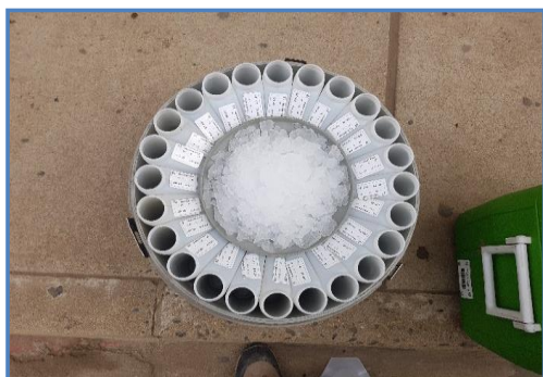
Fotografía 2: Carga de Hielo Equipo Automático