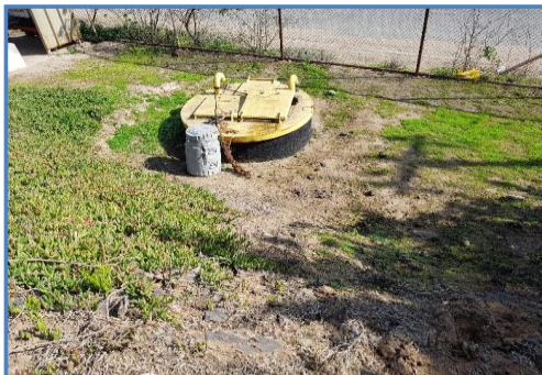
Fotografía 1: Equipo Automático Instalado